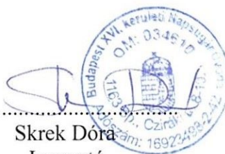
Skrek Dóra Igazgató